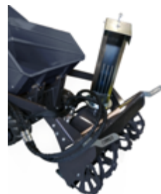
SOUFFLEUR À NEIGE